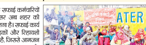
महेंद्रगढ़। नगर पालिका सफाई कर्मचारियों ने बकाया एरियर को लेकर पांचवें दिन भी धरना प्रदर्शन किया गया।

मंडी अटेली। नगर पालिका के सफाई कर्मचारियों की बेमियादी हड़ताल का असर अब शहर की दिनचर्या पर साफ दिखाई देने लगा है। सफाई कार्य टप होने से बाजार, मुख्य सड़कों और रिहायशी इलाकों में कूड़ा जमा होने लगा है, जिससे आमजन को भारी परेशानी का सामना करना पड़ रहा है। बस्बू और गंदगी के कारण लोग आने-जाने में असहज महसूस कर रहे हैं। स्थानीय दुकानदारों और नागरिकों का कहना है कि यदि जल्द समाधान नहीं हुआ तो हालात और बिगड़ सकते हैं। बच्चों, बुजुर्गों और महिलाओं को विशेष दिक्कतें हो रही हैं। स्वच्छता व्यवस्था चरमरने से संकामक बीमारियों का खतरा भी बढ़ सकता है, लेकिन प्रशासन की ओर से अभी तक कोई ठोस कदम उठाने नजर नहीं आ रहा। शहरवासियों का मानना है कि सफाई कर्मचारियों की मांगें चाहे जो भी हों, प्रशासन को बीच का रास्ता निकालते हुए तुरंत हस्तक्षेप करना चाहिए। समय रहते कार्रवाई नहीं हुई तो यह समस्या केवल कर्मचारियों तक सीमित न रहकर पूरे शहर के लिए गंभीर संकट बन सकती है।