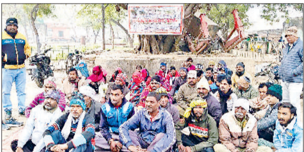
नारनौल। नगर परिषद परिसर में हड़ताल पर बैठे सफाई कर्मचारी।