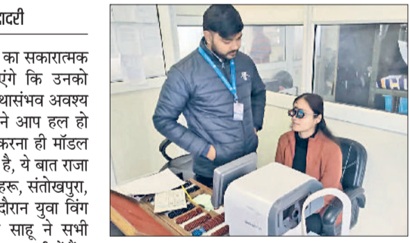
चरखी दादरी। कैंप में मरीज की जांच करते स्वास्थ्यकर्मी।