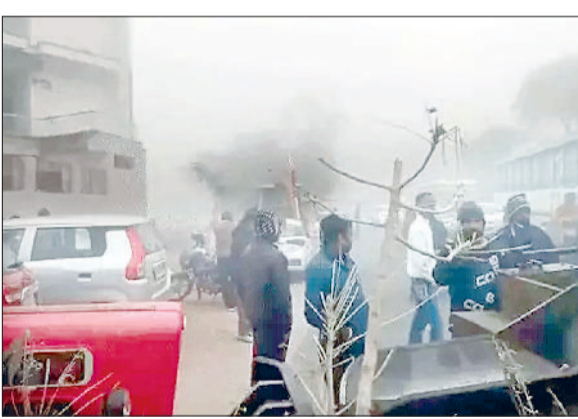
नारनौल। रोड जाम करते बसीरपुर के ग्रामीण।