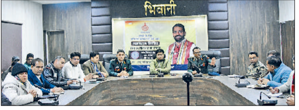
भिवानी। सैनिक भर्ती को लेकर आयोजित बैठक में दिशा निर्देश देते उपायुक्त।

विभिन्न पदों की भर्ती की जाएगी। भर्ती प्रक्रिया को शांतिपूर्वक ढंग से संपन्न करवाने के लिए भीम स्टेडियम के आस-पास पुलिस का सख्त पहरा होगा। किसी भी प्रकार की गैर कानूनी गतिविधि करने वालों के खिलाफ सख्त कार्रवाई अमल में लाई जाएगी। भर्ती प्रक्रिया