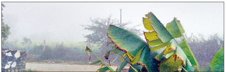
नारनौल। क्षेत्र में छाया कोहरा।